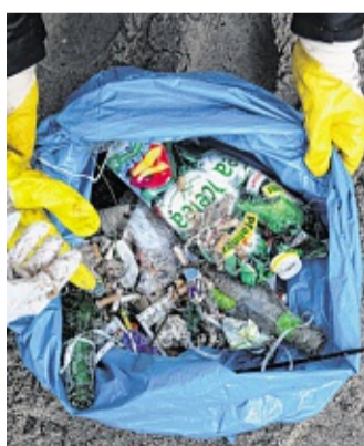
Heute treffen sich viele Freiwillige, um am Sylter Strand Müll zu sammeln. BERND WÜSTNECK

Am heutigen Sonnabend, 16. September , treffen sich daher Freiwillige – sowohl Touristen, als auch Einheimische – in List, Kampen und Hörnum, um die Meere zumindest etwas sauberer zu machen. Dafür wird Müll an den Stränden von 10:30 Uhr bis circa 14 Uhr gesammelt. Jede Hand kann helfen die