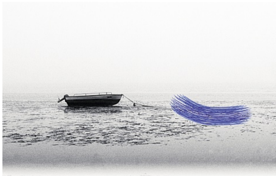
Manchmal verselbstständigt sich das Bearbeiten der Bilder und es entstehen farbliche Überlagerungen und freie Formen, so wie bei der Fotografie „Boot blau“.