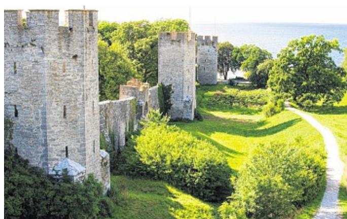
Die mittelalterliche Stadtmauer von Visby ist fast dreieinhalb Kilometer lang und eine der am besten erhaltenen Europas.

Die schwedische Ostseeinsel Gotland wurde in diesem Jahr auf Platz 2 der europäischen Destinationen gewählt, die man auf jeden Fall besuchen sollte. Jedes Jahr treffen die Experten des Reiseführers Lonely Planet eine Auswahl der zehn besten Reiseziele in Europa, die in der „Best of Europe“-Liste geführt werden. Die Entscheidung begründet Lonely Planet mit dem berühmten UNESCO Weltkulturerbe der Hansestadt Visby, einer enormen Dichte an historischen Stätten und den meisten Sonnenstunden in ganz Schweden. Die atemberaubenden Landschaften der Ostseeinsel, die mit ländlichen Idyllen, geheimnisvollen Wäldern und Fischerdörfern aufwarten, in denen die Zeit stehengeblieben zu sein scheint, tun ihr Übriges dazu. Nicht zu vergessen die vielen