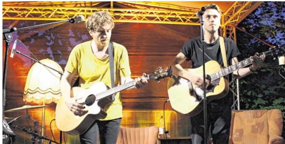
Tim Neuhaus (links) und Clueso standen schon oft gemeinsam auf der Bühne.

Für die Syltfähre ist dies die fünfte gemeinsame Veranstaltung mit dem Independent-Label Grand Hotel van Cleef sowie der Kurverwaltung List auf Sylt. Das gemeinsame Projekt hat mittlerweile Tradition und ist für alle Beteiligten einer der Höhepunkte des Jahres. Wie schon in den vergangenen Jahren wird